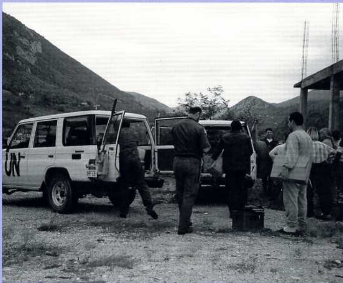
De krijgsgevangenen met ieder een kartonnen doos in hun hand worden uitgewisseld

Ze moeten dit maar zien als mijn persoonlijke ervaringen.