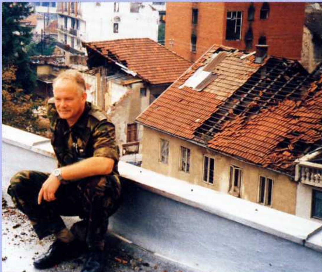
'Gorazde, waar nog nooit een journalist is geweest, daar wordt geen hulp aan geboden.'

En dat terwijl er duidelijk betere locaties te vinden waren. Dan zie je dat niet langer de beste beslissing wordt genomen, maar er te veel naar bijvoorbeeld een burgemeester wordt geluisterd. Nu wil de VN dat UNMO's acht maanden aan de slag gaan. Vier maanden op een zogenaamde soft-spot, een rustige plek en vier maanden op een hot-spot. En volgens mij is twee, uiterlijk drie maanden echt het maximum. Ook al zou een UNMO om die neutraliteit te waarborgen na twee maanden naar een volgende stad verhuizen, dan nog is het werk fysiek en geestelijk te zwaar voor een langere periode.